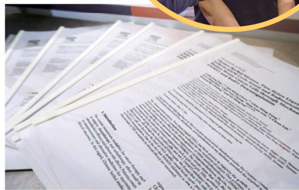
天仙液產品已發表16篇國際論文，25日首度召開研究成果發表會。

【台灣醒報記者林亭好台北報導】「今年6月，天仙液最新3篇研究論文指出：天仙液具有抗氧化、免疫細胞調節及抗腫瘤活性三大特質。」集結16年的深入研究，生技複方「天仙液」25日舉辦學術研究成果發表會。台大教授王萬波領導的團隊研究指出，天仙液裡的人蔘等成分並未刺激雌激素腫瘤增生，反而有抑制癌細胞的作用。